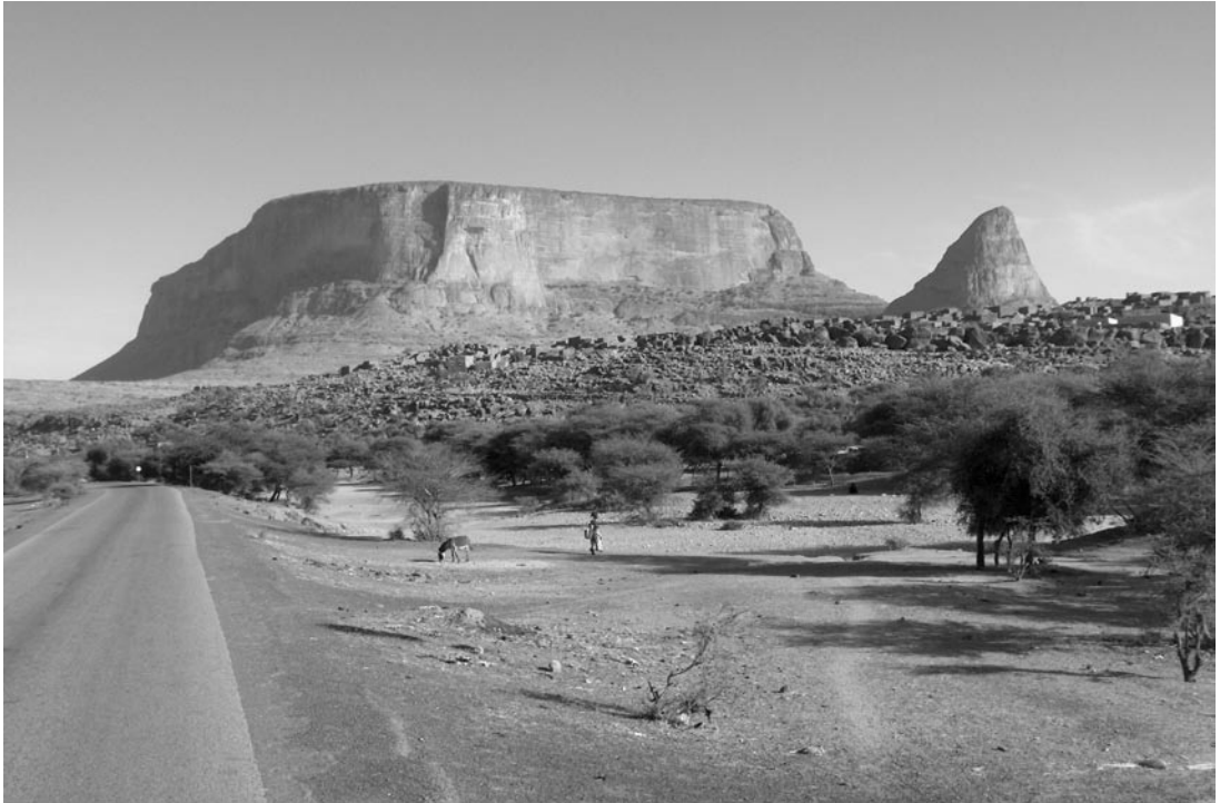
Photo 3: Le Mont et la ville de Hombori (Mali): l'habitat perché défensif est une caractéristique du peuplement de la région.

Hombory Mount and city (Mali) showing up in the hills location