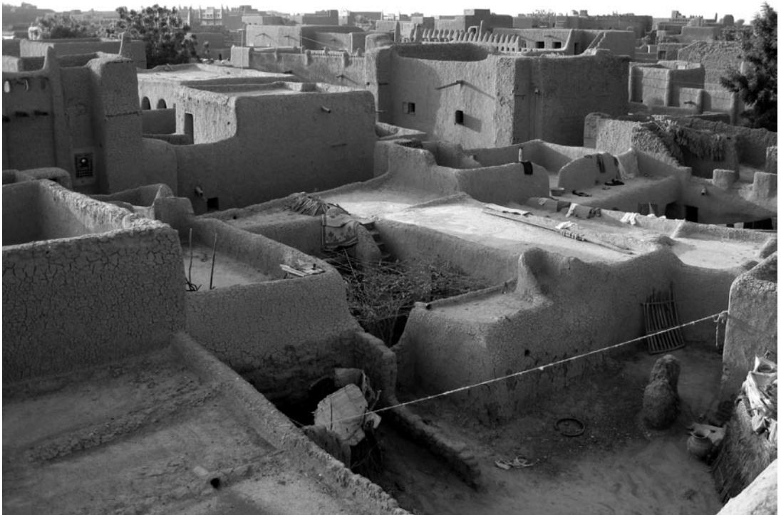
Photo 1: Vue des anciens quartiers de la ville de Djenné montrant l'usage prédominant de la brique de terre crue ( banco ) dans la construction traditionnelle

Old neighbourhoods in Djenné showing the traditional use of mud bricks («banco»)